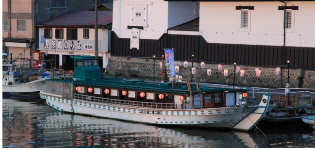
八戸酒造酒蔵前棧橋係留風景