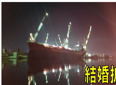
北日本造船タンカー