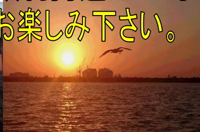
サンセットクルーズ