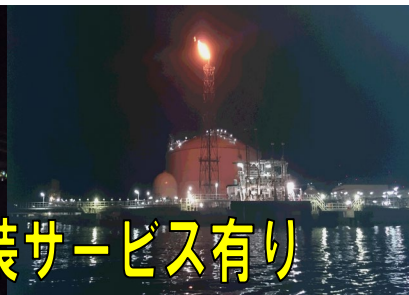
エネオスLNGターミナル