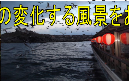
うみねこ餌付け体験