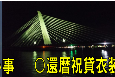
シーガルブリッジ