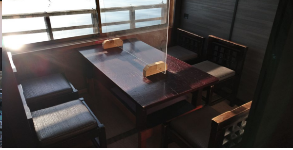
コロナ対策：個室風景（4人部屋4室）